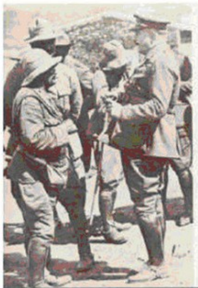
Primo de Rivera visita las tropas españolas en Marruecos.