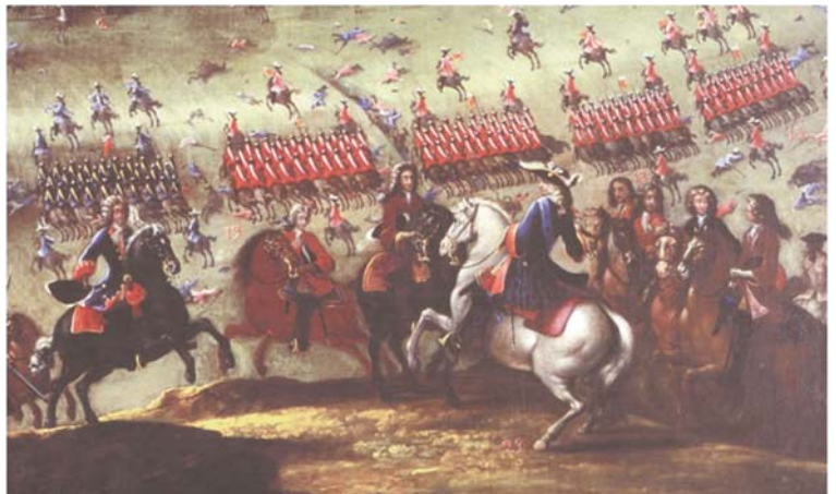
La batalla de Almansa fue un hecho de guerra que originó la ocupación del reino de Valencia por las tropas borbónicas, al que seguiría el dominio sobre los demás reinos. También inauguró la imposición de los Decretos de Nueva Planta, que paulatinamente se fueron extendiendo al resto de los territorios de la Corona de Aragón. Estas circunstancias las recuerda el dicho popular Quan el mal ve d'Almansa, a tots alcanza (Cuando el mal viene de Almansa, a todos alcanza).

Felipe no pudo recuperar Barcelona e incluso tuvo que pasar a Francia, presionado por las tropas aliadas. Además, un ejército inglés, al que se habían unido tropas portuguesas, entró por Salamanca y llegó a Madrid en junio de 1706. Posteriormente tomaría Toledo y Zaragoza. Pero Felipe, apoyado por un movimiento popular castellano, reacciona contra la invasión aliada y obtiene un importante triunfo en la batalla de Almansa (1707), que le permite reconquistar Aragón y Valencia.