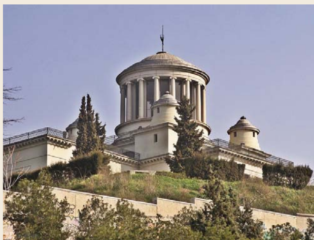
Observatorio Astronómico, de Juan de Villanueva. Madrid.

Cuando en el siglo XVIII empieza a reinar la dinastía de los Borbones, el país toma un rumbo distinto; la administración, las leyes y la economía pasan a ser iguales para todos los reinos, y la política internacional cambia de orientación. Desde ese momento, se inician las primeras reformas, tomadas del movimiento ilustrado europeo y apoyadas por los nuevos monarcas, herederos del absolutismo francés de Luis XIV.