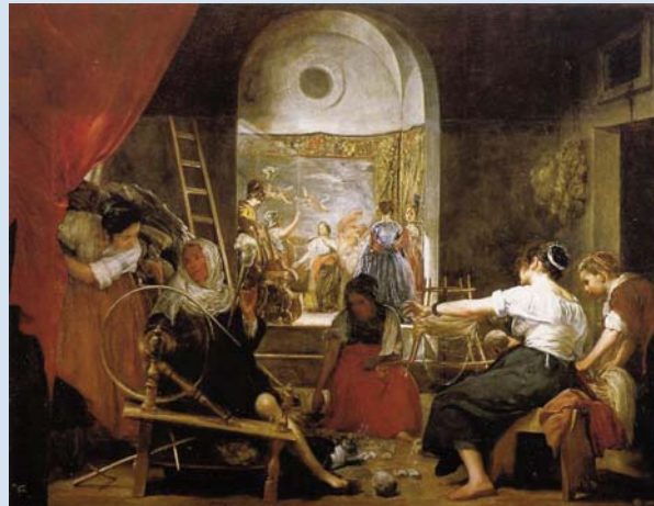
Las hilanderas, de Diego Velázquez. Museo del Prado.

El final del siglo está representado pictóricamente por Carreño de Miranda y Claudio Coello , pintores de Carlos II, y por lo tanto de la escuela madrileña, a la que se incorpora un pintor italiano que influirá en el siglo XVIII, Luca Giordano .