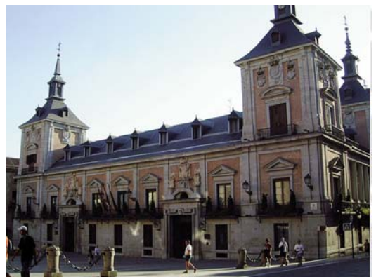
Ayuntamiento de Madrid, de Juan Gómez de Mora. (Wikimedia Commons)

El arquitecto más importante es Juan Gómez de Mora , que construye en Madrid, y cuyas formas influyen en la arquitectura posterior. Un ejemplo representativo de su estilo es el Ayuntamiento de la capital, que sigue la planta de El Escorial, pero le añade elementos decorativos y utiliza el contraste barroco de la piedra y el ladrillo. Este es el modelo que utilizará la nobleza para sus palacios.