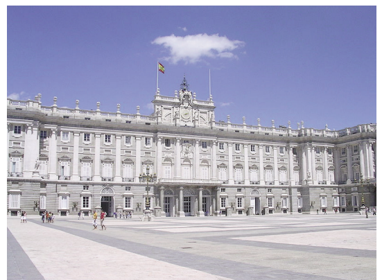
Palacio Real, Madrid, de Filippo Juvara y Juan Bautista Sacchetti.