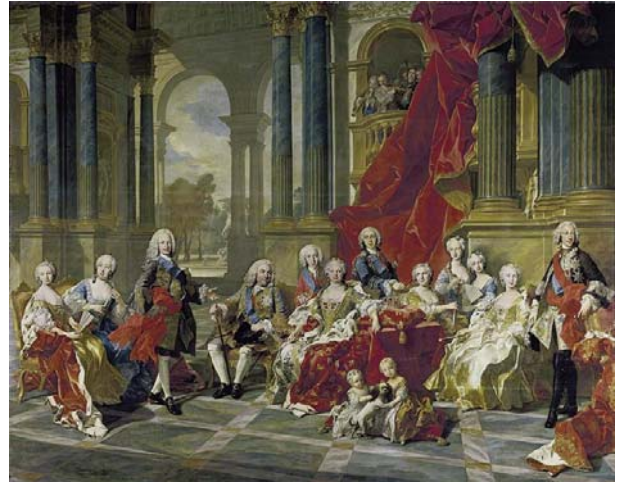
La Familia de Felipe V, de Luis M. van Loo. Museo del Prado.

La lucha contra la Corona de Aragón y su derrota en la batalla de Almansa (1707) dio pie a promulgar, en ese mismo año, los Decretos de Nueva Planta , por los que la fiscalidad, las leyes y la administración castellanas se impondrían en Valencia y Aragón. Las sucesivas victorias militares sobre las tropas catalanas y mallorquinas sirvieron de excusa para abolir sus fueros, en 1715 y 1716 respectivamente, con lo que quedaba unificada prácticamente casi toda España, salvo Navarra y las provincias forales vascas. Las reformas abarcaron diferentes ámbitos del Estado.