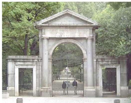
Puerta Real del Jardín Botánico, de Francisco Sabatini.

Las primeras obras neoclásicas, con marcado carácter italianizante, las construye Francisco Sabatini , arquitecto del rey en Nápoles. La Real Casa de la Aduana, las puertas de Alcalá y de San Vicente, la Puerta del Real Jardín Botánico y numerosas actuaciones en otras obras en construcción, constituyen su legado arquitectónico.