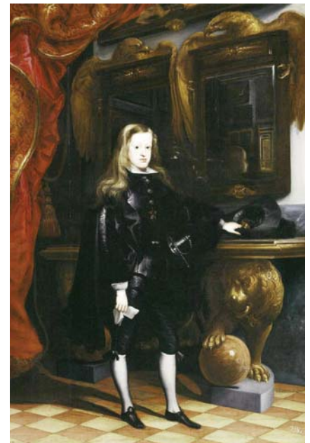
Carlos II, de Carreño de Miranda.

Finalmente sería elegido Felipe de Anjou, lo que provocaría la Guerra de Sucesión .