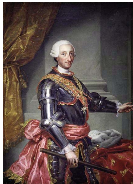
Carlos III, por Antonio Rafael Mengs. Museo del Prado.