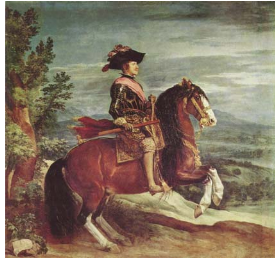
Felipe IV. Diego Velázquez. Museo del Prado.