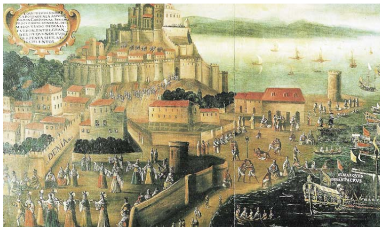
Embarco de moriscos en el Grao de Denia en 1613.

La expulsión de los moriscos se debió al interés de la monarquía por reforzar la unidad religiosa en la Península, iniciada en 1492 con la expulsión de los judíos, y para evitar las tensiones que existían entre la población cristiana y estos nuevos conversos. También se argumentó que podían apoyar desde dentro de la Península una posible invasión de los turcos, que merodeaban por las costas mediterráneas. Su expulsión supuso un descenso demográfico importante, y una pérdida de mano de obra especializada en la artesanía y en la agricultura, que hizo descender la productividad, sobre todo en Valencia y Aragón, de donde salieron mayoritariamente.