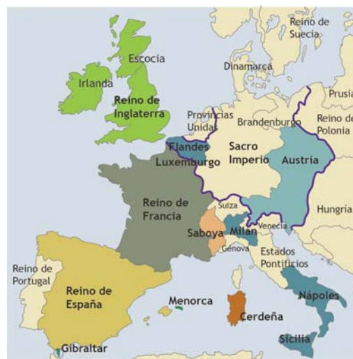
Tratados de Utrecht y Rastadt Territorios cedidos a Inglaterra Territorios cedidos a Austria Territorios cedidos a Saboya Límites del Sacro Imperio

En adelante España perdía su protagonismo en Europa y Francia olvidaba la política agresiva de Luis XIV. Se reforzó la idea del equilibrio europeo como única fórmula política en las relaciones internacionales; y el Imperio y Francia, que conservaban su poder, garantizarían ese equilibrio en el continente. Mientras, Gran Bretaña, que aparecía como la gran triunfadora, defendería la libertad de los mares y su poderosa armada le aseguraría el dominio sobre ellos.