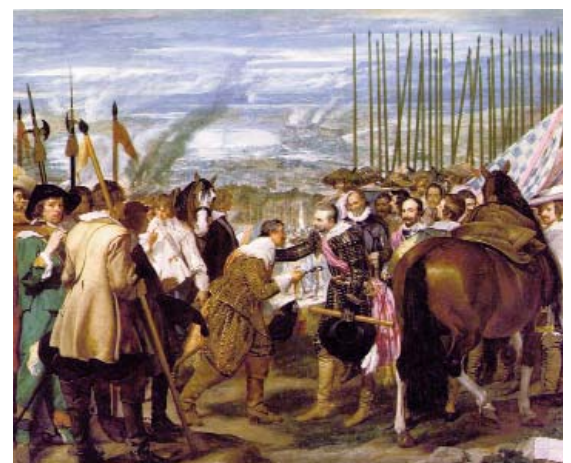
La Rendición de Breda. Diego Velázquez. Museo del Prado.