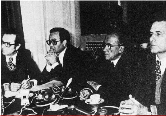
Miembros de la Junta Democrática en París.

de fuera del país. Estos grupos pidieron a la entonces Comunidad Económica Europea que no aceptara a España como miembro mientras no hubiera un sistema democrático homologable con los países de la citada organización. El régimen consideró esta reunión como una conspiración y lo denominó el “ contubernio ” de Múnich y muchos de los participantes en ese encuentro fueron arrestados al volver a España.