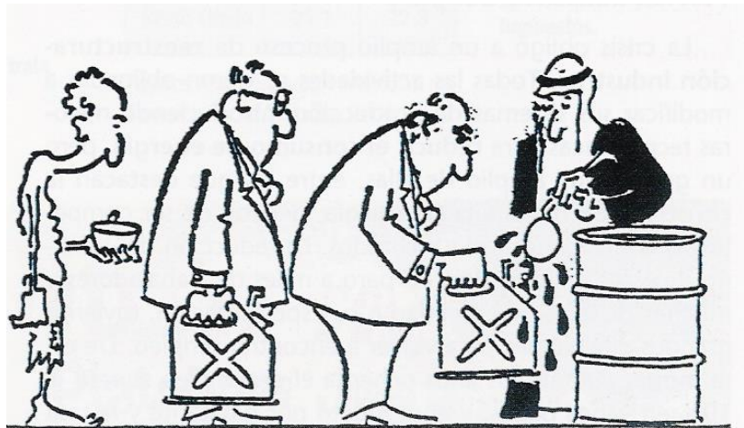
Caricatura sobre la crisis del petróleo de 1973.

El crecimiento fue ininterrumpido entre 1961 y 1973 y fue debido en gran parte a la bonanza económica internacional que se da en este periodo que posibilita el crecimiento, de la misma manera, cuando llegue la crisis del 1973 el contexto internacional influirá poderosamente sobre la economía española.