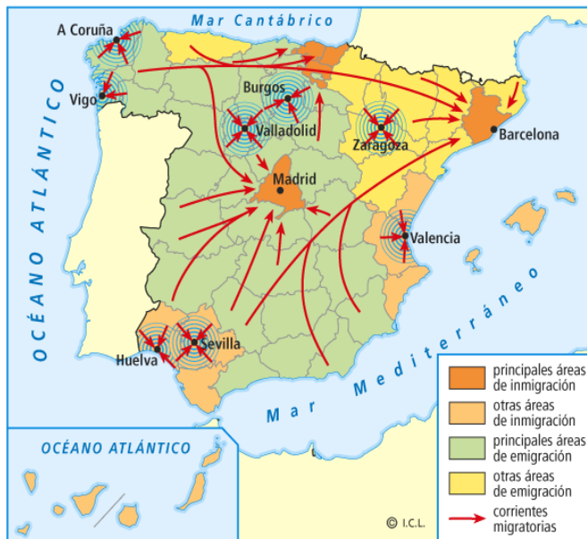
Migraciones interiores entre 1960 y 1975.

Al lado de las migraciones interiores, se estableció un flujo ininterrumpido de emigrantes españoles que de forma continua saldrán para la Europa desarrollada . Estos emigrantes saldrán con carácter temporal, pero en muchos casos fijarán su residencia definitiva en países como Alemania, Francia, Holanda o Suiza. Desde el punto de vista económico su papel será decisivo pues generan importantes capitales (ahorro) que son