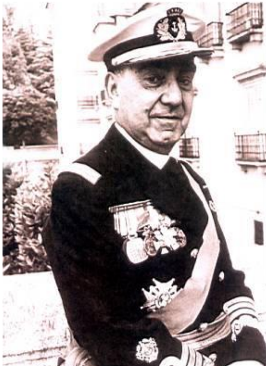
Luis Carrero Blanco (1903-1973).

con la Ley Villar Palasí de 1970, que pretendía la equiparación con Europa, extendiendo la enseñanza básica gratuita hasta los 14 años a través de la EGB. Es el sistema educativo anterior al actual.