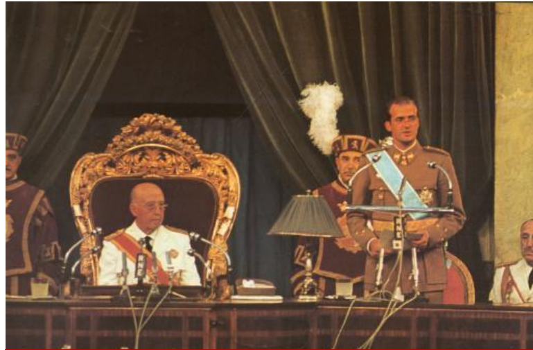
D. Juan Carlos como sucesor jura los principios fundamentales del Movimiento ante Franco en julio de 1969.

Los tecnócratas pusieron en marcha desde 1957 una amplia reforma de la administración pública. Se trataba de adaptar la administración a las nuevas circunstancias de desarrollo económico. Por otro lado, en 1958 se aprobó la sexta ley fundamental, la ley de Principios Fundamentales del Movimiento , una recopilación de leyes y normativas anteriores, que definía al régimen como “democracia orgánica” y al Estado español como una “monarquía tradicional, católica, social y representativa”.