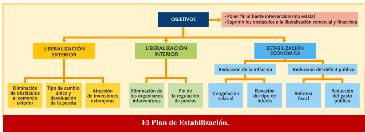
El Plan de Estabilización.

Franco había formado, en 1957, un nuevo gobierno en el cual dos personalidades destacadas del grupo tecnócrata –técnicos ligados al Opus Dei-- ocuparon dos carteras básicas del área económica. Éstas fueron la de Comercio, desempeñada por Alberto Ullastres , y la de Hacienda por Mariano Navarro Rubio . A lo largo de la década de los 60 serán siempre políticos de esta tendencia tecnócrata los que dirigirán la política económica en España y los que dirijan la mayoría de los ministerios.