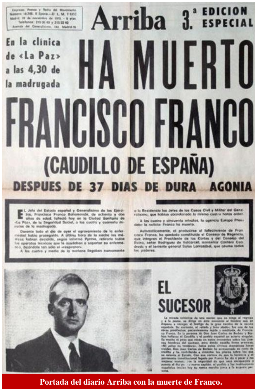
Portada del diario Arriba con la muerte de Franco.

necesidad de una reforma constitucional.