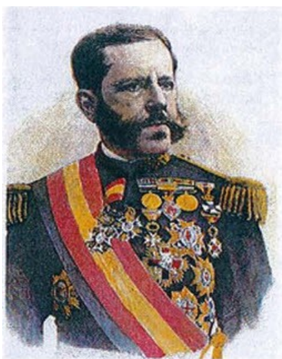
General Valeriano Weyler