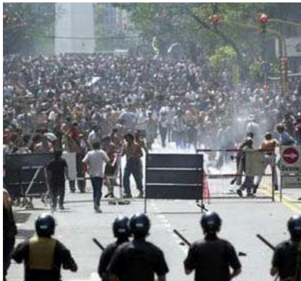
Huelga de obreros en un país desarrollado contra el cierre e una fábrica que se traslada a un país subdesarrollado donde es más barato producir.

• Las multinacionales han sido uno de los principales actores de la globalización. Sus dimensiones internacionales y sus enormes recursos - muchas de ellas poseen más capacidad financiera que muchos Estados- les conceden una gran influencia tanto sobre los gobiernos como sobre las instituciones económicas internacionales. Ellas son las que han perseguido con más ahínco la creación de un mercado mundial libre de regulaciones. Puede afirmarse también que son la mejor representación del capitalismo actual, ya que, cada vez más, concentran el poder económico en manos de unos pocos.