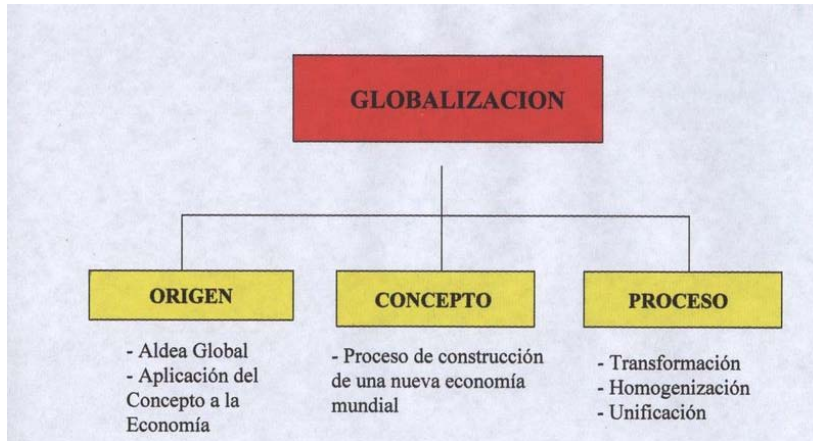
Algunos aspectos de la globalización o mundialización.

Ya desde el final de la Segunda Guerra Mundial, se produjo una tendencia al aumento de las relaciones comerciales internacionales y del peso de las multinacionales en la economía. Pero dos circunstancias de las últimas décadas han intensificado el proceso de mundialización