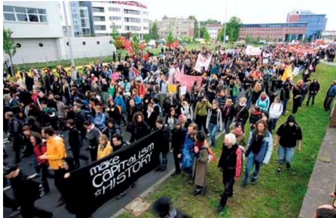
Manifestación antiglobalización en Rostock.

Se trata de grupos de distintos países, e incluso de ideologías muy diversas. Forman parte de este movimiento organizaciones no gubernamentales como Intermón-Oxfam ; colectivos como el Movimiento por la Justicia Global , el Foro Social Mundial , la organización ATTAC (Asociación para la Tasa Tobin 1 y la Acción Ciudadana), la Marcha Mundial de Mujeres , el Movimiento de Resistencia Global (MRG); y muchas personalidades individuales. Como puede observarse, no se trata de un Único grupo organizado ni tampoco existen unos líderes reconocidos mundialmente. Es más bien -como ya ha sido calificado- un movimiento de movimientos.