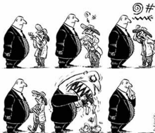
Viñetas alusivas a la desigualdad entre ricos y pobres y la eliminación de estos últimos.

Los más beneficiados por el fenómeno de la globalización han sido los países desarrollados, que controlan las grandes instituciones económicas internacionales - FMI, OMC, Banco Mundial- y han establecido unas regulaciones muy favorables para sus intereses. Los países desarrollados han encontrado nuevos mercados para sus productos, al