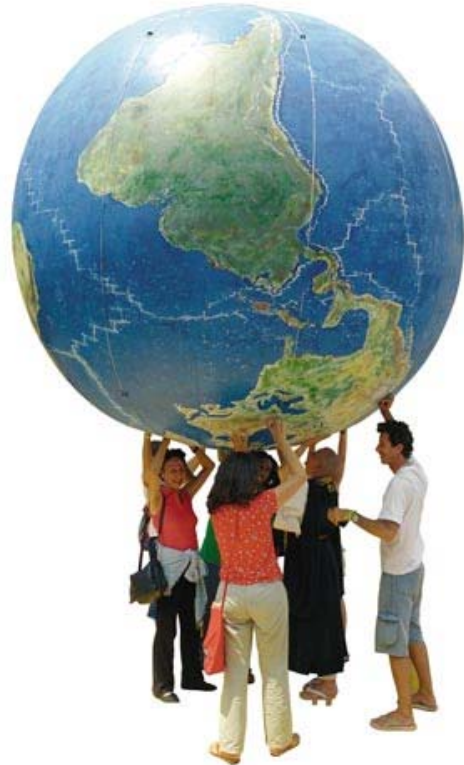
El mundo al revés es uno de los símbolos de los movimientos antiglobalización.